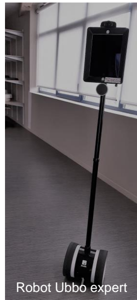
Robot Ubbo expert