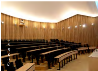
Amphi Ellul, PJJ, Bordeaux