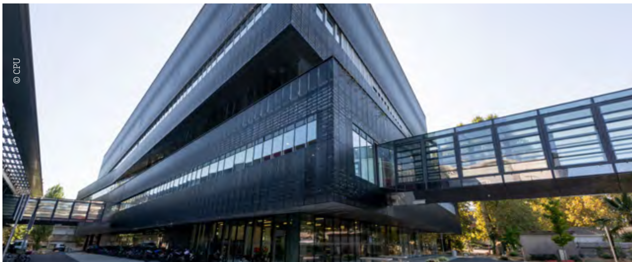
Neurocampus, campus Carreire