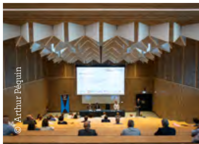
Amphi, Bâtiment H, Pessac