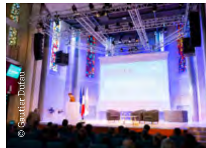
Salle Agora, Haut-Carré, Talence